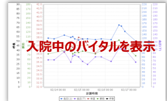
入院中のバイタルを表示